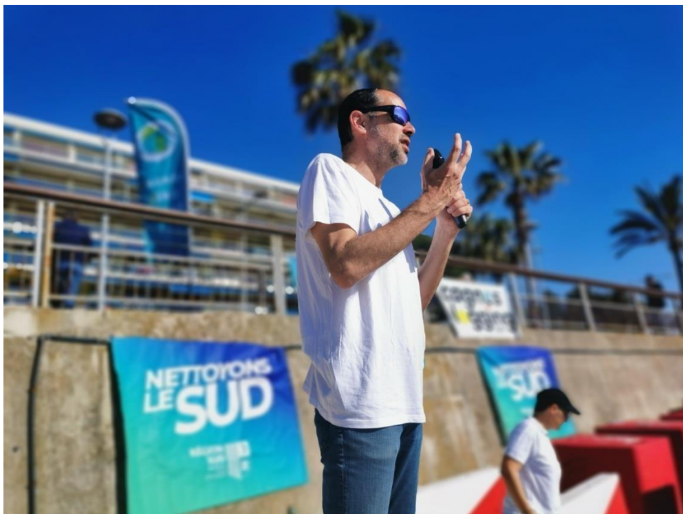
« 1h de ramassage max, suivi d'un tri des déchets » Cagnes-sur-Mer