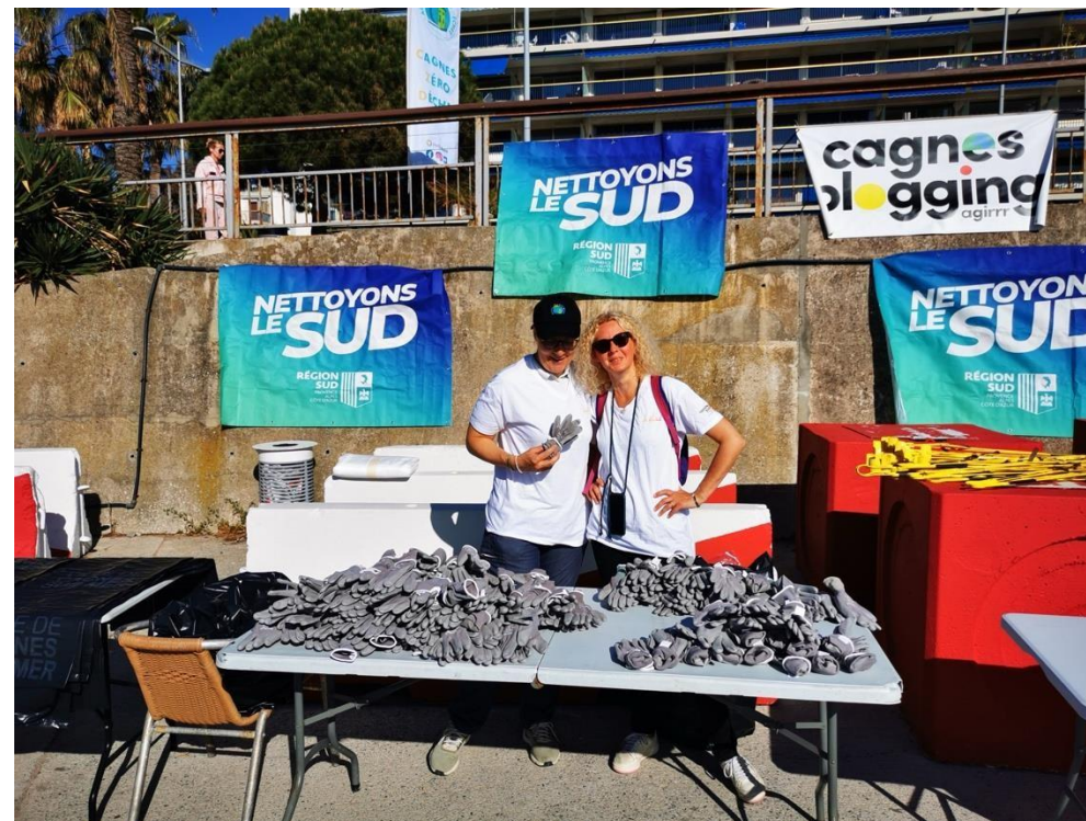
Prévoir un parcours de récupération du matériel Cagnes-sur-Mer