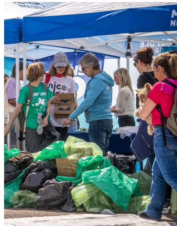
Nice ©Andrea TAMIAZZO